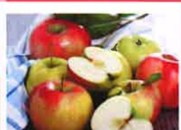
OCTOBRE Producteurs locaux