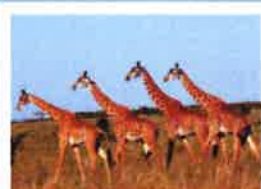
MAI Continent africain