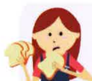
NOVEMBRE Semaine réduction des déchets