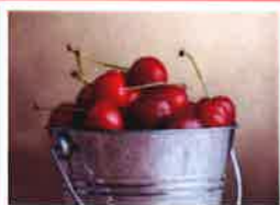
JUIN Fruits de saison