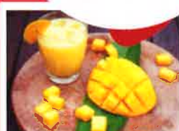
DÉCEMBRE Fruits exotiques