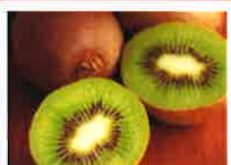
AVRIL Circuits courts