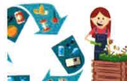
MAI/JUIN Semaine développement durable