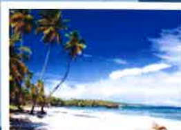
JUIN Continent océanien