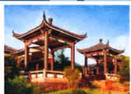
MARS Continent asiatique