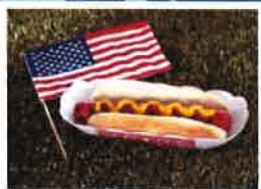
JANVIER Continent américain